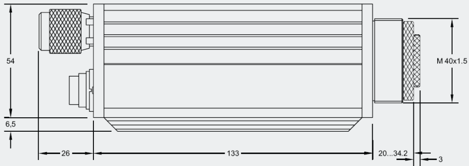
온도계 주요 치수 (Target 뷰 렌즈 옵션)